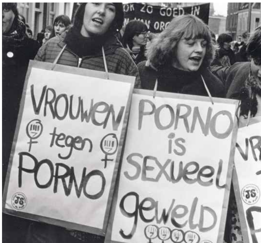
Demonstratie in Nijmegen in 1981. De aanleiding was een proces tegen twaalf vrouwen die waren gearresteerd omdat ze actie voerden tegen het openen van een pornobioscoop. De demonstranten wilden dat het proces geen aanklacht werd tegen vrouwen, maar wel tegen porno en tegen het geweld door mannen.

die vrouwen zogenaamd meer opwinden, aangezien dit 'biologisch zo bepaald is'. 54