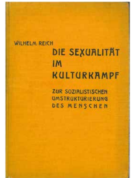
De term ‘seksuele revolutie’ vindt zijn oorsprong in de publicatie van Reich, Die Sexualität im Kulturkampf (1936). Het boek kreeg in de Verenigde Staten de titel The Sexual Revolution .

Net daarom raakte seks zo verbonden met de studentenprotesten die bekendstaan als mei ’68. Een grote generatie jongeren kreeg eind jaren 1960 immers opeens toegang tot hoger onderwijs – een tendens die gestimu-