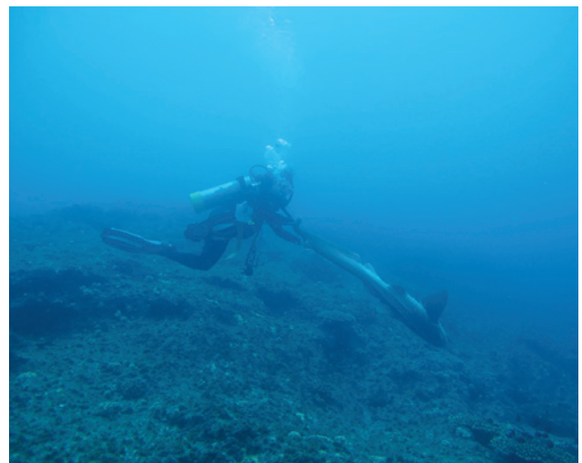
Figuur 1. Voorbeeld van hoe een zebrahaai tijdens een duik in TI wordt gebracht door druk uit te oefenen op de staart.

Tonische immobiliteit bij haaien kan optreden door de dieren in de normale fysiologische beweging te beperken en/of door ze in een afwijkende houding te brengen (Gallup, 1977; Gallup et al., 1980; Watsky en Gruber, 1990; Davie et al., 1993). Dit kan door plaatselijke druk uit te oefenen ter hoogte van de rug- (Whitman et al., 1986), borst- of staartvin (Williamson et al., 2018) en het dier hierbij op de rug te draaien (Whitman et al., 1986; Watsky en Gruber, 1990; Henningsen, 1994) (Figuur 1). Bij het optreden van TI wordt het dier immobiel (Watsky en Gruber, 1990; Henningsen, 1994) en reageert het niet meer op schadelijke of pijnlijke stimulatie (Williamson et al., 2018). Verder zou TI bij haaien ook ontstaan door water in de kieuwkamer te pompen (Wells et al., 2005).