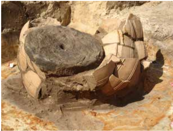
Fig. 1. Dolium in situ. De binnendiameter van de rand van de dolium bedraagt 33cm, de diameter van de buik 48cm. De diameter van de maalsteen meet 39cm.

Binnen de dassenburcht werd een opmerkelijke vondst aangetroffen: een volledige maalsteen dekte een grotendeels volledig dolium af. De vondst bevond zich op een kruising van twee gangen in de burcht. Reeds tijdens het veldwerk kon vastgesteld worden dat de bodem van het dolium niet aanwezig was. Wel werd een fragment van een tegula aangetroffen. Mogelijkerwijs werd het dolium zonder bodem bovenop de dassenburcht geplaatst, waarbij de tegula fungeerde als afsluiting van de bodem en de maalsteen als afsluiting van het dolium zelf. Het was echter onmogelijk vast te stellen of de dassenburcht op moment van depositie nog in gebruik was, of dat het dolium in de burcht belandde door de graafactiviteiten van dassen. Mogelijk bezweek het dolium onder het gewicht van de maalsteen en zakte het daardoor grotendeels in de dassenburcht, waar het verder open klapte tegen de randen van de gang. De voorraadpot betreft een zeer courant, globulair type met platte, naar binnen georiënteerde rand (type Gose 356-358 2 , zelf een variant van Hofheim 78). Deze vorm is alomtegenwoordig vanaf de Flavische tijd tot in de 3de eeuw. Gezien de uitzonderlijke context werd de vondst op het terrein in 3D geregistreerd. 3