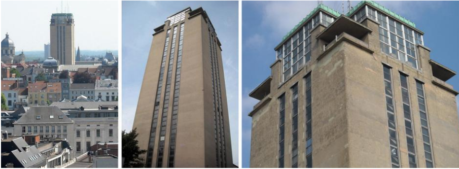
Fig. 1 - La Boekentoren di Ghent.