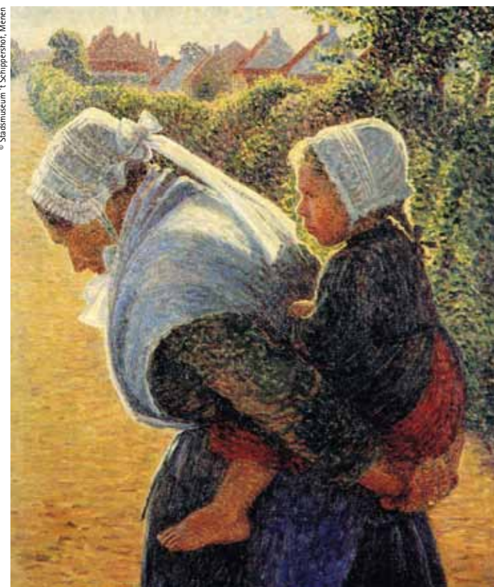
Mane Becube, oil on canvas from Serruys's Neo-Impressionist period, ca. 1895–1900