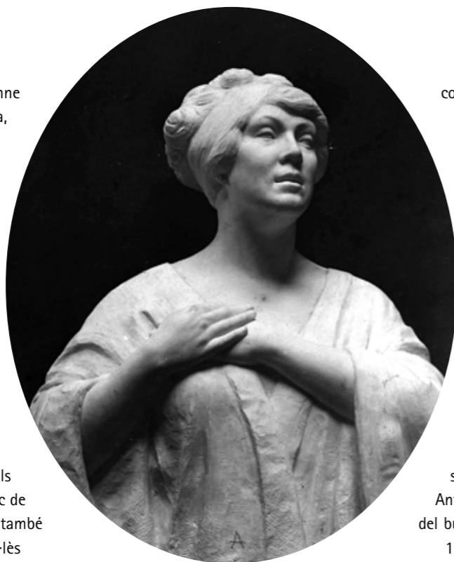
Bust of singer Povla Frisch (Frijsh), one of numerous works in marble by Serruys, 1910

A partir de 1898, Yvonne Serruys va començar a exposar els seus llenços a París, on vivia ocasionalment, a l'avinguda de l'Opéra, amb la