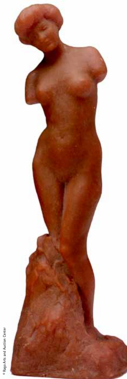
Female Nude, a 1905–1910 glass paste work by Serruys and Despret

The statuettes Yvonne Serruys created between 1905 and 1914 can likewise mainly be classified as Art Nouveau, though some already reveal a transition to the more robust and stylised lines of her nudes, portraits and public monuments from the interbellum , clearly linking up with Art Deco and the sculptural style of the Parisian Bande à Schnegg . Serruys's first monumental statues, Faune aux enfants ( Faun with Children ) and Les Baigneuses ( The Bathers ), created before 1910 and sometime later erected in the Parisian public space, were praised by Octave Maus for their elegance, eloquence and decorative qualities, as well as their more solid and sturdy modelling technique. When exhibited at the Paris Salon in 1912, both groups had respectively already been bought