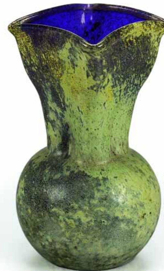
Glass vase, blown in the mould, ca. 1906 by Georges Despret and Yvonne Serruys, part of the Düsseldorf Glasmuseum Heinrich collection

After 1905, she only exhibited three-dimensional work, especially bronze statuettes of elegant nudes