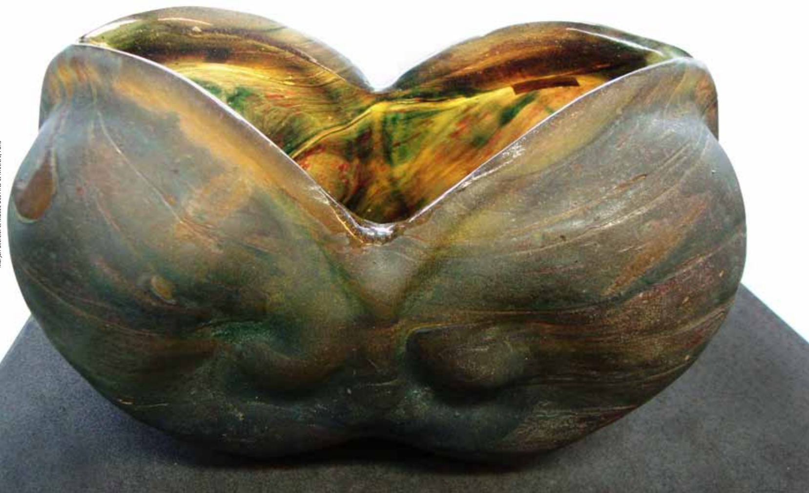
Gerro en vidre bufat de 1906–1907, signat conjuntament per Serruys i Despret. Forma part de la col·lecció del Museu d'Arts i Oficis de París

edition objets d'art are mostly inspired by flora and fauna, and characterised by organic forms and curvy lines, either in their general shape, or applied three-dimensionally onto the surface (on the exterior of vases or the inside of dishes), or within the pâte de verre itself, as whirling strings of colour. A few of these glass objects are also beautiful examples of Japonism, such as a purple glass-paste bowl with dragonflies, or the Leaping Carp in glass paste (seven copies of which, in different colours, are recorded in museums worldwide), which several authors ascribe to Yvonne Serruys, even though it does not carry her signature or monogram. In 1908, Marcel Pays called Despret's artistic glass work innovative, admirable and consistent with "modern, elegant and tormented taste, as suited to all who unhesitatingly leave the beaten track of artistic industrialisation". Other objects by Serruys and Despret have more firm-lined shapes. Serruys's designs thus represent two different tendencies in Art Nouveau: the curvy line on one hand, and the more geometrical with influences from German Jugendstil and Austrian Secession on the other (she was one of the few visitors of the Palais Stoclet in those times).