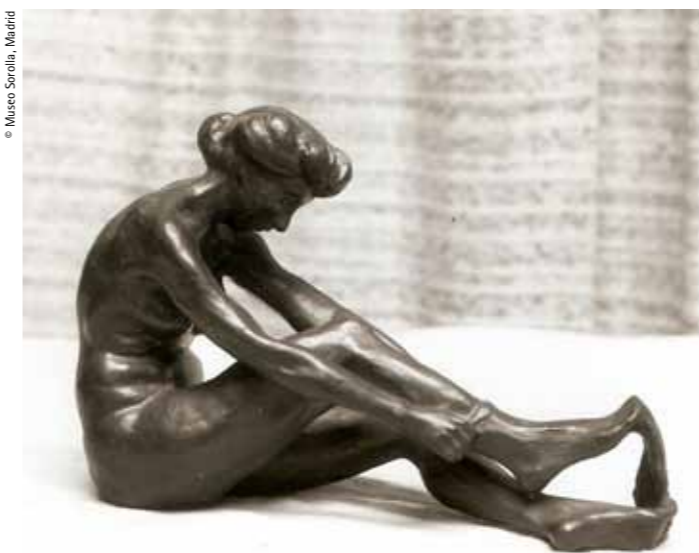
The Stockings, a bronze from 1905