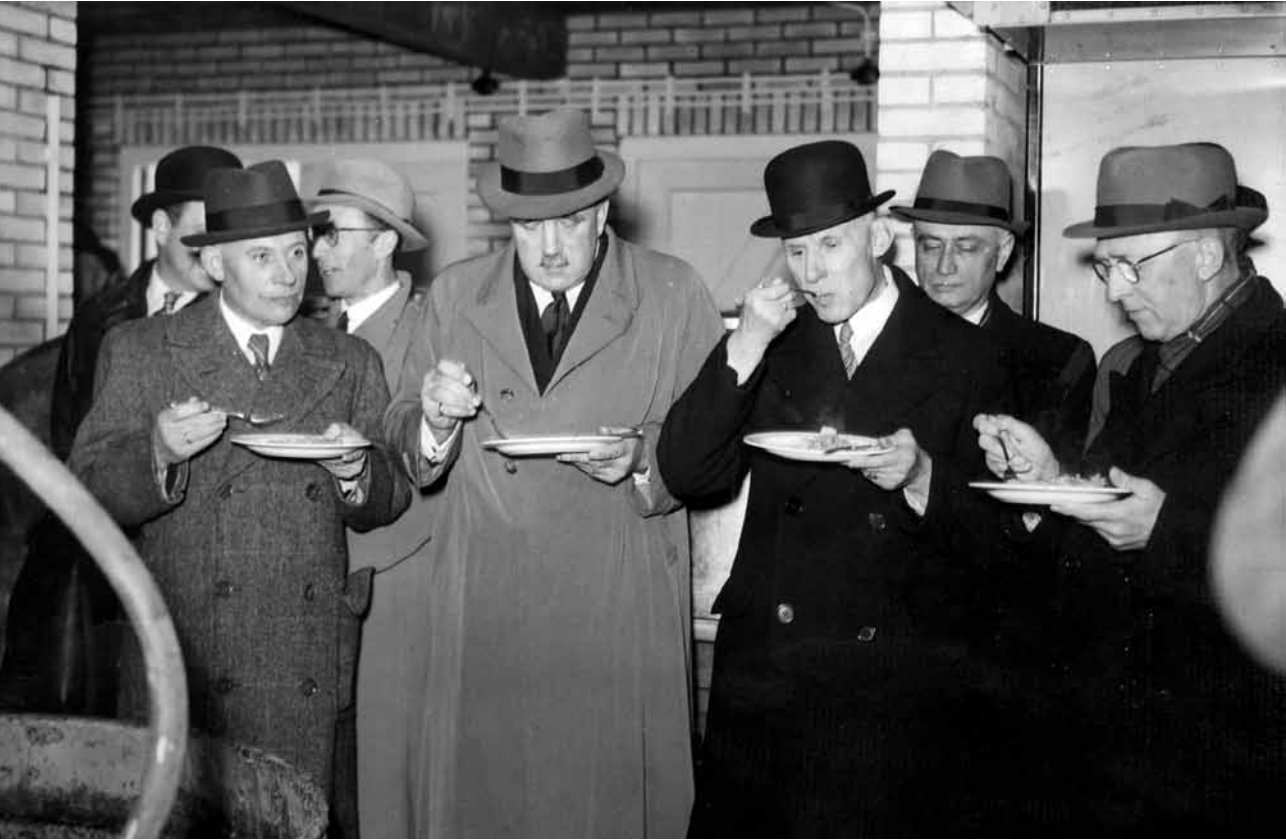
▲ Opening van de centrale gaarkeuken in Den Haag, 2 april 1941. Tweede van links is ir. S.L. Louwes, directeur-generaal van de Voedselvoorziening.